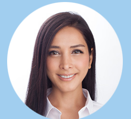
サヘル・ローズ氏